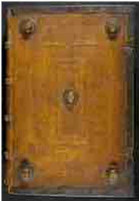
Canticum Beatae Mariae quod magnificat nuncupator . KU Leuven Bibliotheken, sig. RC81