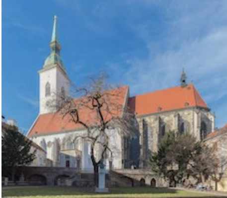
Collegiate church of Saint Martin (currently cathedral)