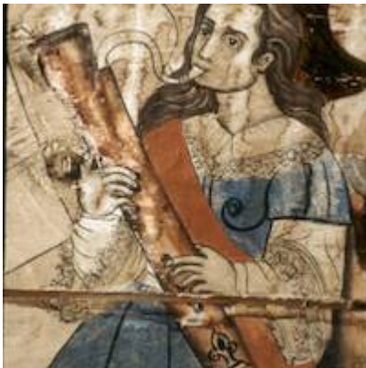
Dulcian player. Church of Santiago. Nurio (Michoacan)