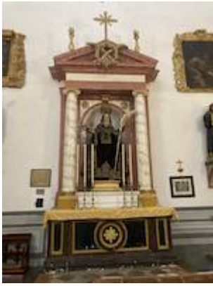
San Francisco de Paula (attributed to Pedro de Mena).