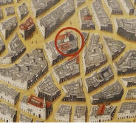
Convent of Nuestra Señora de la Candelaria. Vista Arámburu (Cádiz, c. 1675)