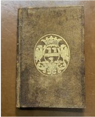
Binding. Juan Martínez. Arte de canto llano . (Alcalá: Diego de Angulo, 1565)