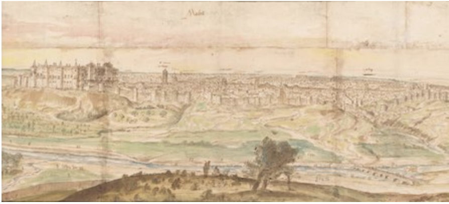
Madrid. Anton van den Wyngaerde (1562)