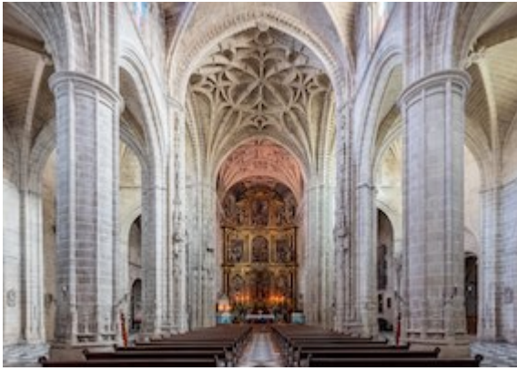
Inside of the church of San Miguel. Jerez