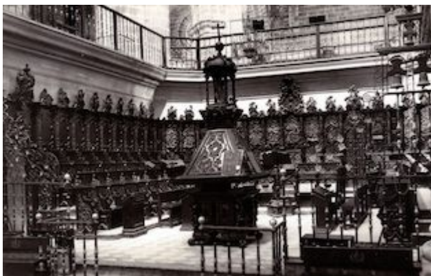
Choir. Collegiate church of San Salvador. Jerez