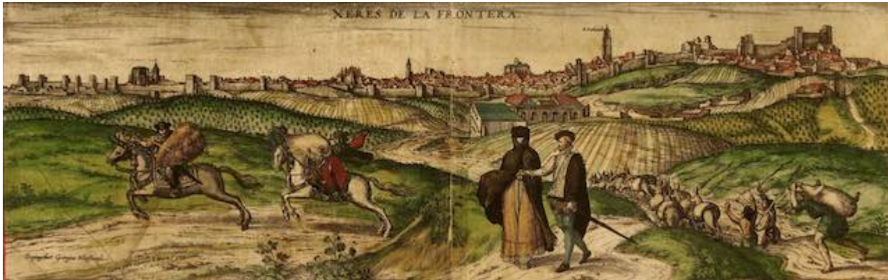
Jerez de la Frontera. Joris Hoefnagel. Georg Braun. Civitates Orbis Terrarum , vol. 2. Colonia, 1575