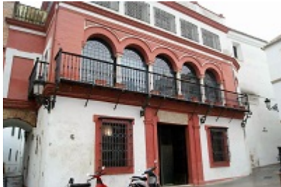
Old courthouse of Carmona (s. XVI)