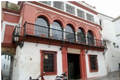
Old courthouse of Carmona (s. XVI)