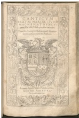
Title page. Canticum Beatae Mariae . Francisco Guerrero [D-Mbs 2 Mus.pr. 30(7)]