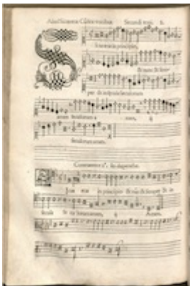
Canticum Beatae Mariae . Francisco Guerrero [D-Mbs 2 Mus.pr. 30(7)], fol. 25v