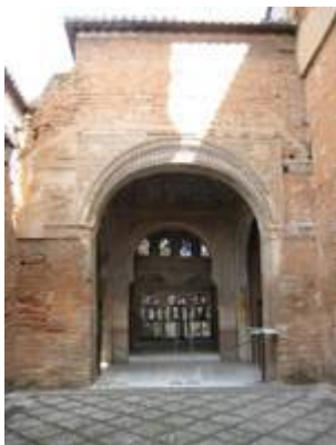
Chapel of the convent of San Francisco de la Alhambra.