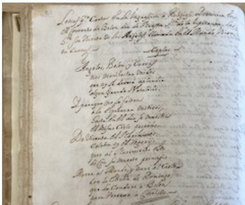
"Ángeles, Belen y Cuevas". José Vicente Ortí y Mayor