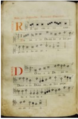
"Requiem eternam". Missa pro Defunctis . Francisco Guerrero E-Vac Llibre d'atril 171], fol. 25v