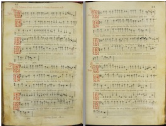
Dixit Dominus. I Tonus . Francisco Guerrero [E-Vac Llibre d'atril 179, pp. 43-44]