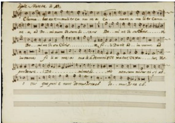
Clamabat autem . Francisco Guerrero [E-Vac leg. 1, pieza 12]

http://www.youtube.com/embed/6Xo-o3RMVQ0?iv_load_policy=3&fs=1&origin=http://www.historicalsoundscapes.com