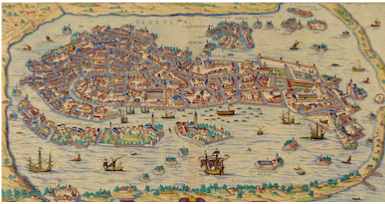
Venetia. Civitatis Orbis Terrarum. G. Braun & F. Hogenberg (c. 1572)