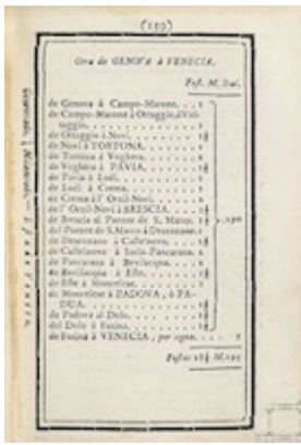
Travel from Genoa to Venice. Itinerario de las carreras de posta (1761)

"http://www.youtube.com/embed/fWMdIX1ABoQ?iv_load_policy=3&fs=1&origin=http://www.historicalsoundscapes.com"