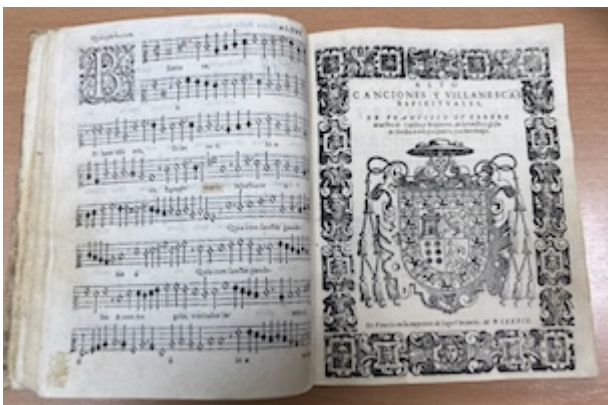
Cover page. Canciones y villanescas (1589). Francisco Guerrero