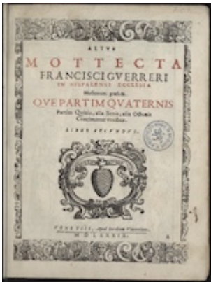
Mottecta... Liber secundus (Venecia: Giacomo Vincenzi, 1589) [G 4875]. Francisco Guerrero