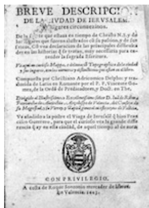
Breve descripción de la ciudad de Jerusalén (1603) [E-Pap Mont. 6.779]