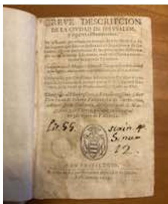
Breve descripción de la ciudad de Jerusalén (1603) [E-Bbc 7-I-1/1]