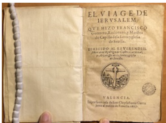
El viage de Iervsalem (1603) [E-Bbc Res. 247-12]