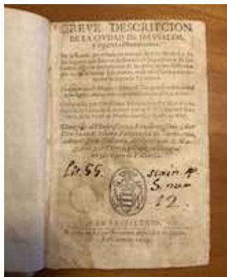
Breve descripción de la ciudad de Jerusalén (1603) [E-Bbc 7-I-1/1]