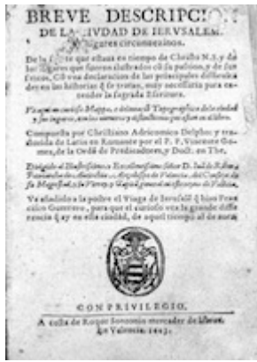
Breve descripción de la ciudad de Jerusalén (1603) [E-Pap Mont. 6.779]