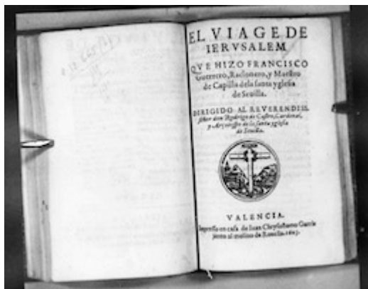
Breve descripción de la ciudad de Jerusalén (1603) [E-VAbv XVII/363]