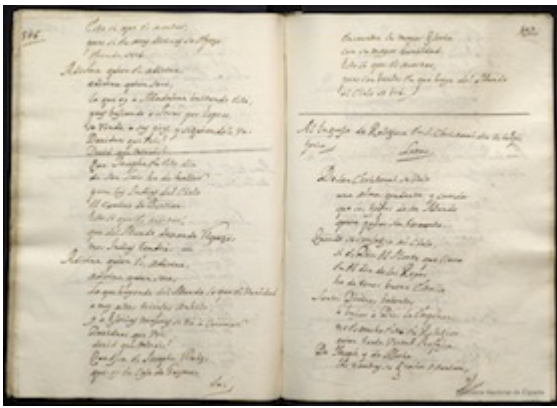
Al ingreso de religiosa en San Cristóbal, día de la Epifanía