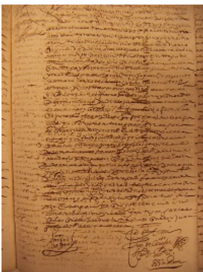
Obligation of the minstrel Miguel Jiménez to guard a box of flutes (1621)

"http://www.youtube.com/embed/F7OMicMYRsl?iv_load_policy=3&fs=1&origin=http://www.historicalsoundscapes.com"