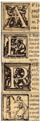
Woodcut initials. Historia de cosas del Oriente . Amaro Centeno. Córdoba: Diego Galván, 1595