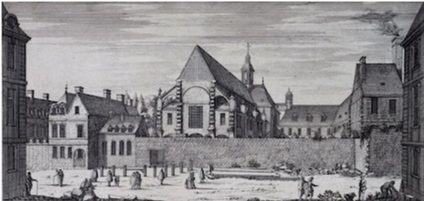
Convent of the Minimes de la place Royale