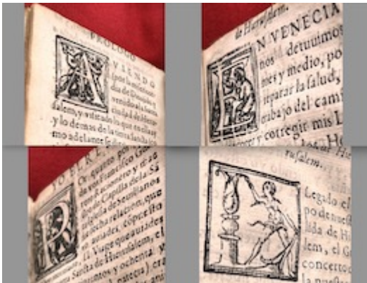
Woodcut initials. Viaje de Hierusalem . Francisco Guerrero. Córdoba: [Diego Galván], [c.1596]