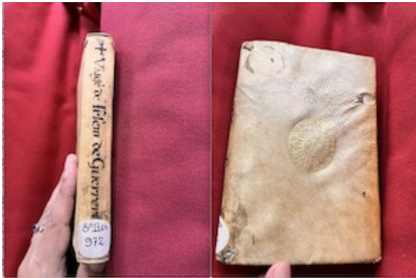
Spine and cover. Viaje de Hierusalem . Francisco Guerrero. Córdoba: [Diego Galván], [c.1596]