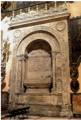
Tomb of Francisco Guerrero at the foot of the funerary monument of Luis Salcedo y Azcona