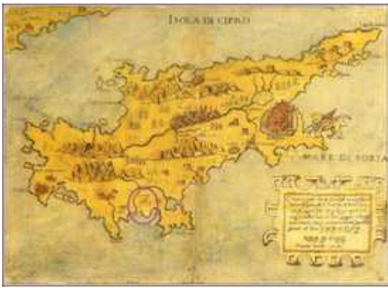
Isola di Cipro. Ferrando Bertelli (Roma, 1562)