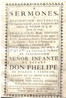
Sermones y descripción histórica del Capítulo General... , (Valladolid, 1741)