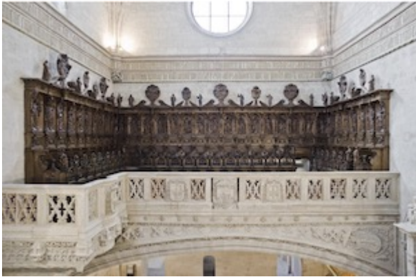
Choir stalls of the convent of San Diego in Valladolid. Pedro de Sierra (1735). Currently in the choir of the college of San Gregorio.