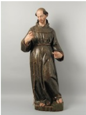
Saint Peter of Alcántara. Pompeo Leoni (1606-1607). From the convent of San Diego in Valladolid