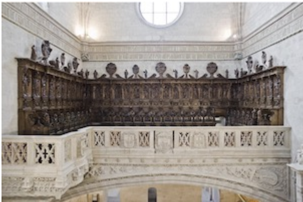
Choir stalls of the convent of San Diego in Valladolid. Pedro de Sierra (1735). Currently in the choir of the college of San Gregorio.