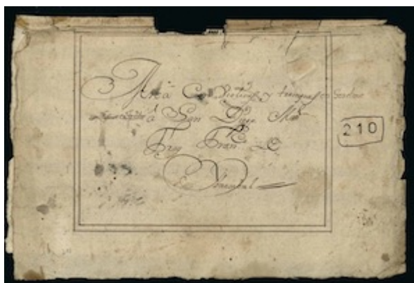
Seráfico taller. Fray Francisco de Ibarzabal (1740). Title page