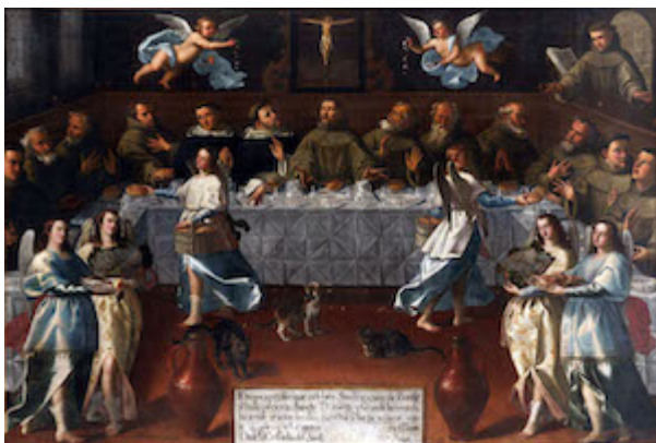
Miracle in the refectory . Felipe Gil de Mena (ca. 1644). From the convent of San Francisco in Valladolid