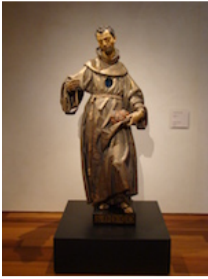
Didacus of Alcalá. Gregorio Fernández. From the convent of San Francisco in Valladolid