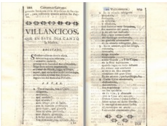
Villancico of the 10th of June dedicated to Didacus of Alcalá