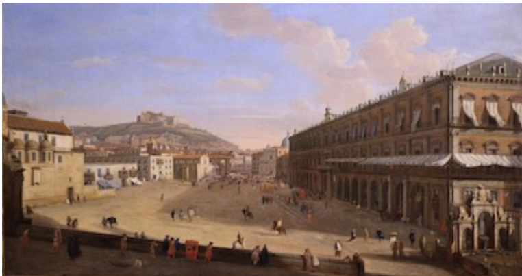
View of Largo di Palazzo. Gaspar van Wittel (c. 1700-1725)