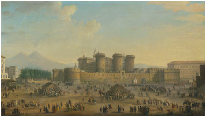
Largo di Castello in Naples. Antonio Joli (c. 1764)