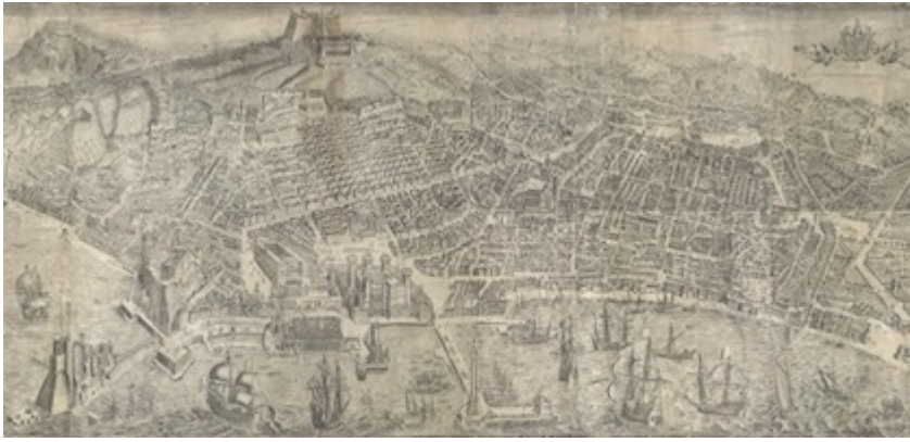
Pianta di Napoli. Alessandro Baratta (1629)