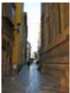
Cárcel street.