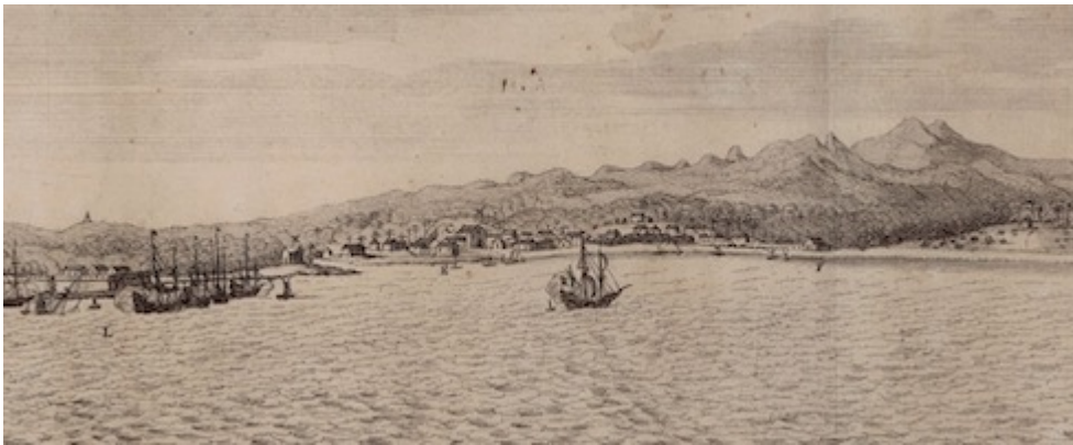
Insula S. Thomae. Frans Post (1645)