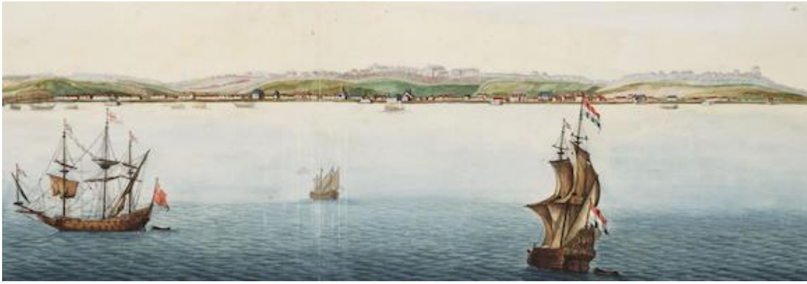
View of Loanda. Johannes Vingboons (c. 1665)