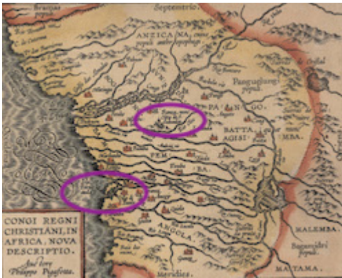
Regni Christiani, in África, Nova Descriptio Congi. Filippo Pigafetta (1591)