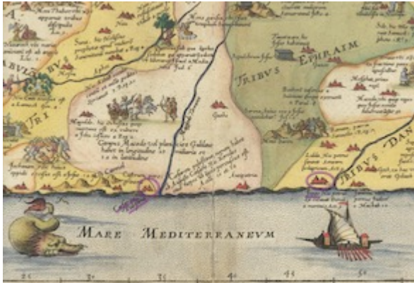
Descriptio Et Situs Terrae Sanctae Alio Nomine Palestina . Sebastian Münster (1593)