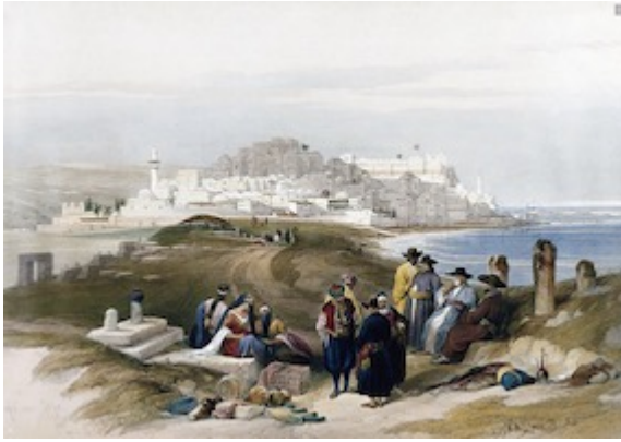
Jaffa. David Roberts (1839)