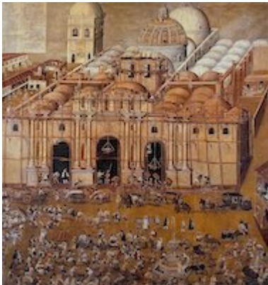
Construction of the Cathedral of Santiago de Guatemala. Antonio Ramírez Montúfar (c. 1678)