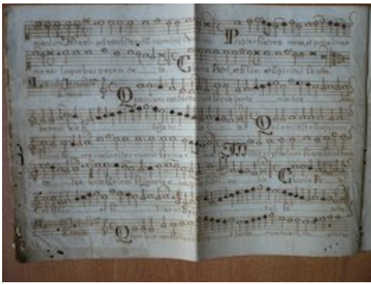
Lauda Jerusalem. 8º Tono. Tiple. [Francisco Guerrero] [GCA-Gc Papeles de Música 451]