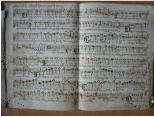
Dixit Dominus . 1º Tono. [Francisco Guerrero] [GCA-Gc Papeles de Música 451]