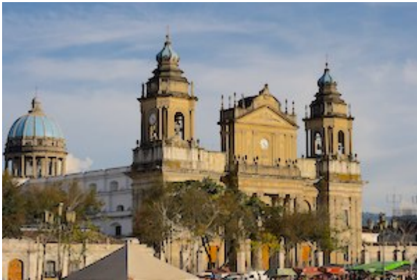
Cathedral of Santiago