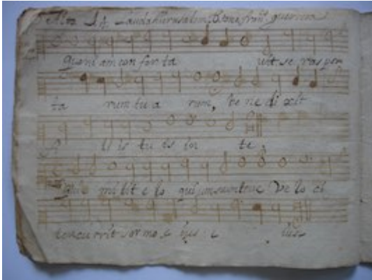
Lauda Jerusalem . 8º Tono. Alto. Francisco Guerrero [GCA-Gc Papeles de Música 547]