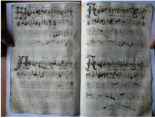
Anima mea Dominum. Primi toni. Francisci Guerrero [GCA-Gc Ms. 2, fols. 14v-20r]