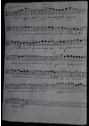
"Tiple 1º. Albricias, zagalas . Anónimo. CENIDIM, CSG.010.