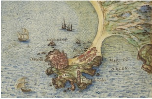
"Coruña". Descripcion de Espana y de las Costas y Puertos de sus Reynos . Pedro Texeira (1634)