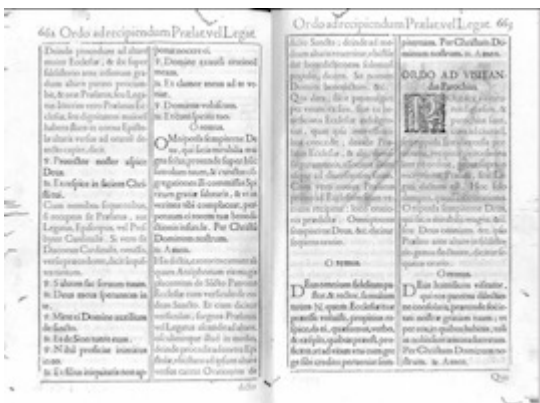
Pontificale Romanum Clementis VIII Pont. Max iussu restitutum atque editum. Roma: Giacomo Luna, 1595 , pp. 662-663