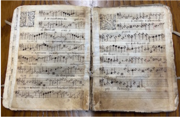
Archivo de la Capilla Real de Granada. Bassus. Mottecta (1589)