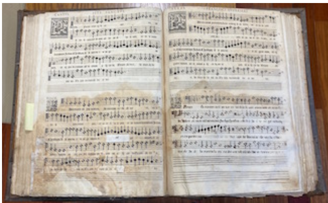
Archivo de la Capilla Real de Granada. Missarum liber secundus (1582). Libro de polifonía nº2, fols. 82v-83r