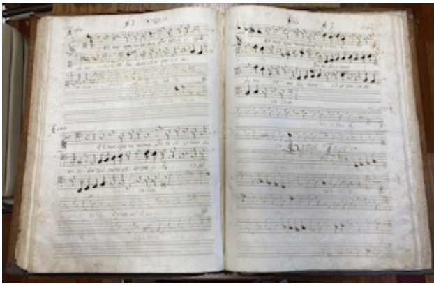
Archivo de la Capilla Real de Granada. "Sed nos qui vivimus". [Francisco Guerrero]. Libro de polifonía nº7, fol. 75v-76r