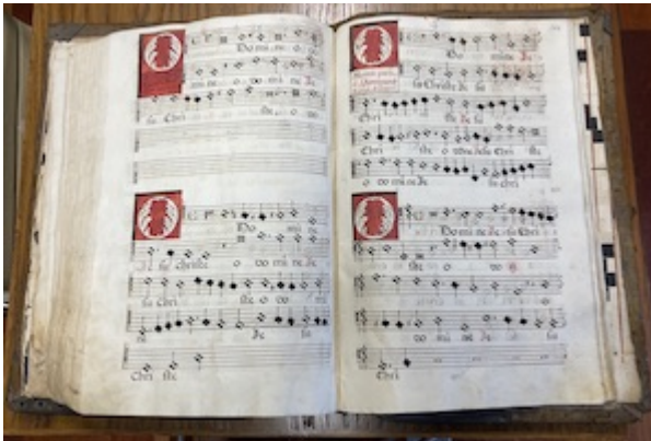
Archivo de la Capilla Real de Granada. O Domine Iesu Christe . Francisco Guerrero. Libro de polifonía nº8, fols. 161v-162r