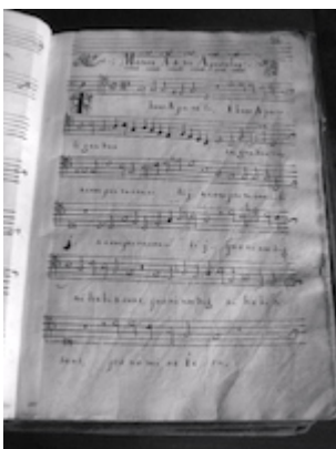
Archivo de la Capilla Real de Granada. Bassus. Ibant apostoli gaudentes . [Francisco Guerrero]

"http://www.youtube.com/embed/Woj0b-3uKp4?iv_load_policy=3&fs=1&origin=http://www.historicalsoundscapes.com"