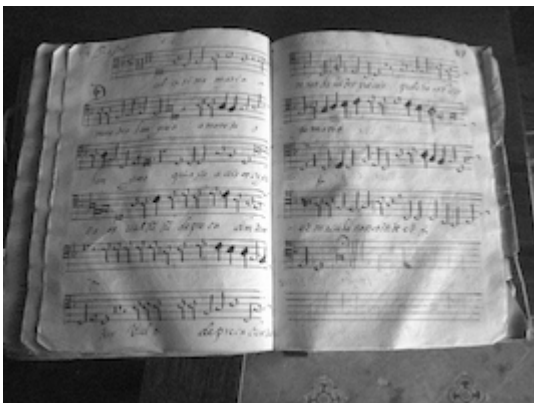
Archivo de la Capilla Real de Granada. Bassus. Dulcissima Maria . [Francisco] Guerrero