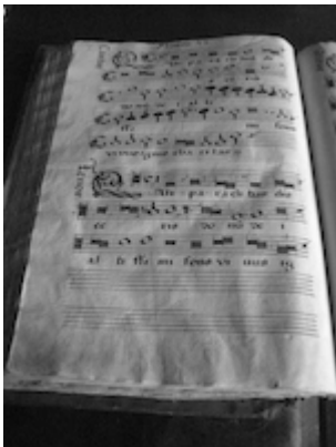
Archivo de la Capilla Real de Granada. "Qui paraclitus" [Francisco Guerrero]. Libro de polifonía nº1, fol. 114v