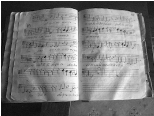
Archivo de la Capilla Real de Granada. Bassus. Dulcissima Maria . [Francisco] Guerrero