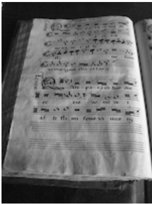
Archivo de la Capilla Real de Granada. "Qui paraclitus" [Francisco Guerrero]. Libro de polifonía nº1, fol. 114v