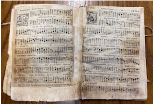
Archivo de la Capilla Real de Granada. Altus. Motteta (1570)