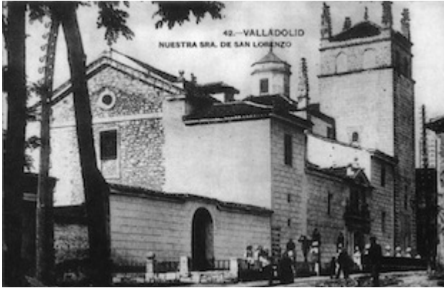
Church of San Lorenzo