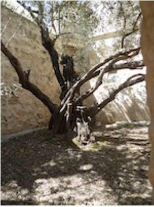
Olive tree in the courtyard of the Church of the Holy Archangels