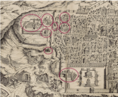
Stations in the Armenian Quarter and Mount Zion. Map of Jerusalem. Friar Antonino de Angelis (1578)