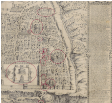
Stations on the Via Dolorosa. Map of Jerusalem. Friar Antonino de Angelis (1578)