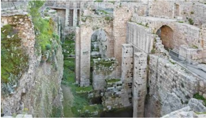
Pool of Bethesda