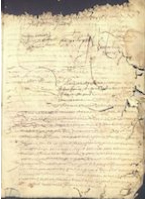
Signature of Diego López