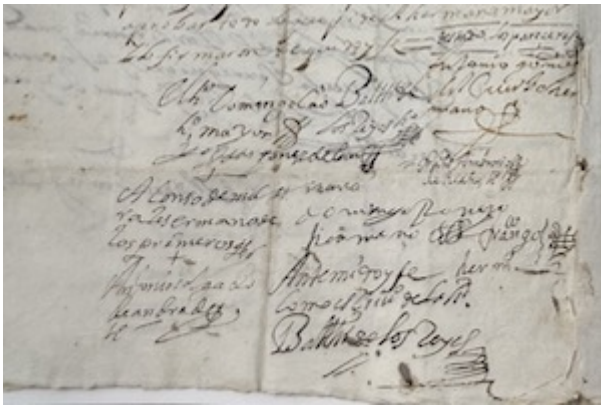
Signatures of the confreres. Archivo Histórico Diocesano de Granada, Caja 108F, pieza 46