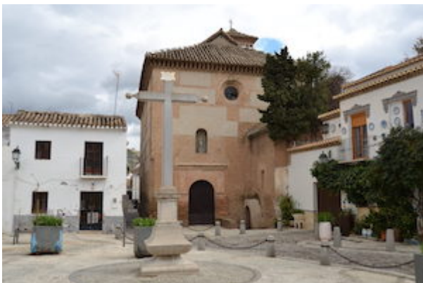
San Bartolome square