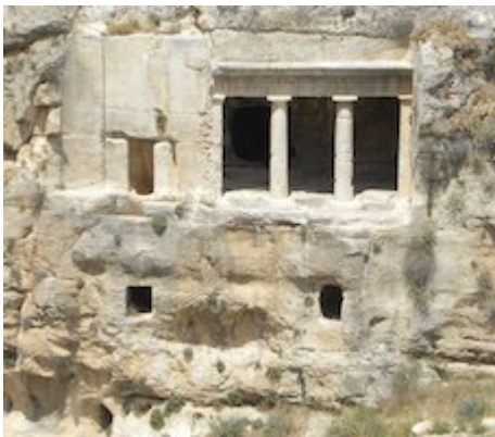
Tomb of Benei Hezir