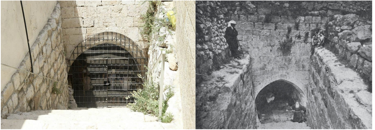
Fountain of Our Lady (Gihon Spring)