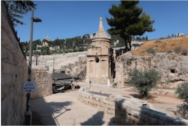
Tomb of Absalom