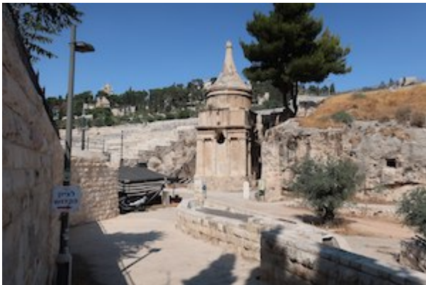
Tomb of Absalom