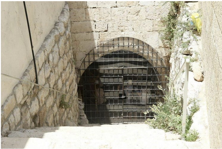
Fountain of Our Lady (Gihon Spring)