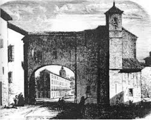
Church of Santiago. Bernardo Rico (1864)