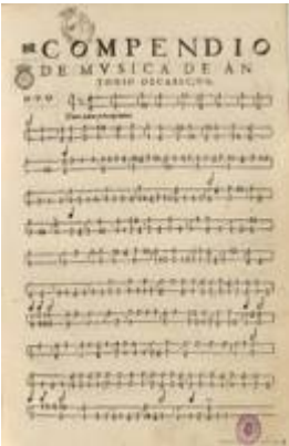
"Tres dúos para principiantes". Obras de música para tecla, arpa y vihuela (1578), fol. 1r. Antonio de Cabezón