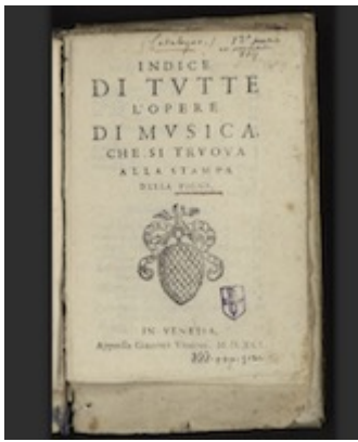
Indice di tutte l'opere di musica che si troua alla stampa della Pigna (Venecia: Giacomo Vincenzi, 1591)