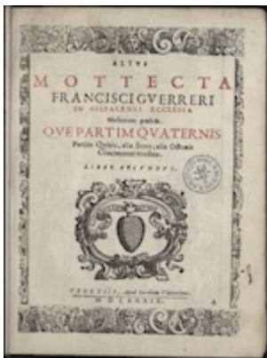
Mottecta... Liber secundus (Venecia: Giacomo Vincenzi, 1589) [G 4875]. Francisco Guerrero