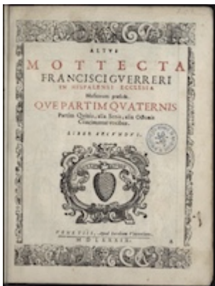
Mottecta... Liber secundus (Venecia: Giacomo Vincenzi, 1589) [G 4875]. Francisco Guerrero