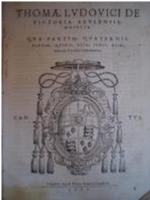
Tomás Luis de Victoria. Motecta . 1572. Monasterio de Santa Ana in Ávila