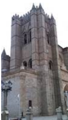
tower of the Cathedral of Ávila.