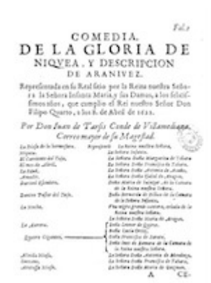
La gloria de Niquea . Juan de Tassis y Peralta, conde de Villamediana