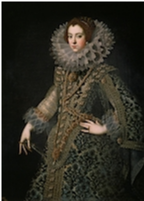
Isabel de Borbón. Anonymous (c. 1620)