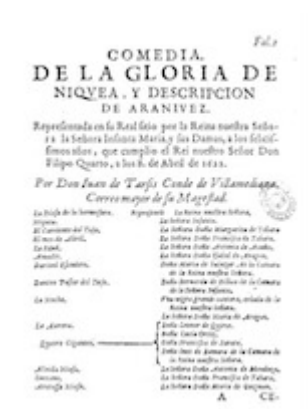
La gloria de Niquea . Juan de Tassis y Peralta, conde de Villamediana