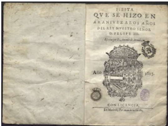
Fiesta que se hizo en Aranjuez a los años del Rey Nuestro Señor D. Felipe III. Antonio Hurtado de Mendoza