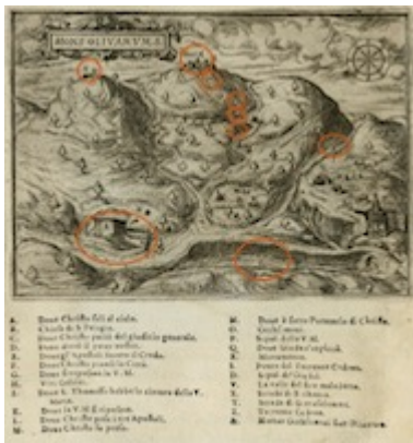
Mons Olivarums. Il devotissimo viaggio di Gerusalemme. Jean Zuallart (1587), p. 152