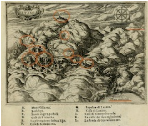
Betania. Il devotissimo viaggio di Gerusalemme. Jean Zuallart (1587), p. 177