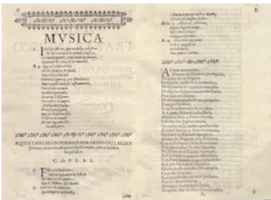
Epinicio armónico , pp. 4-5