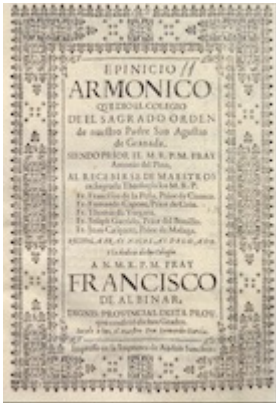
Title page. Epinicio armónico