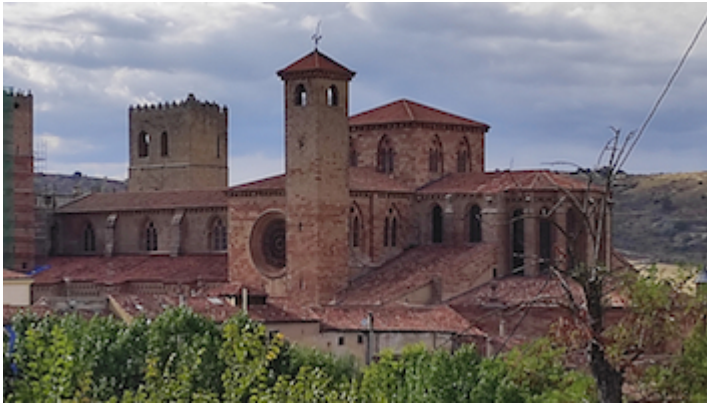
Cathedral of Sigüenza