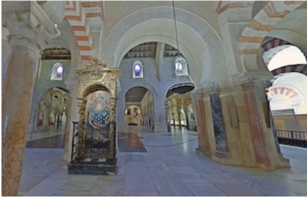
Altar of Santa María del Sol and arch of the nave 17