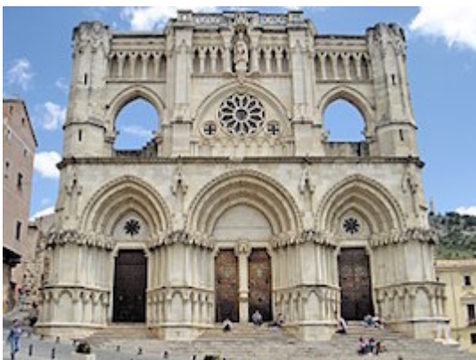
Cathedral of Cuenca