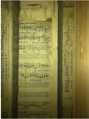
Wooden pipe from the organ of the Cuenca Cathedral, lined white leaves of book of T.L. de Victoria.

"http://www.youtube.com/embed/FWhRfYypTg?iv_load_policy=3&fs=1&origin=http://www.historicalsoundscapes.com"