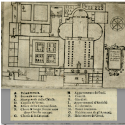
Basilica of the Nativity, St Catherine's Chapel and monastic complex. Il devotissimo viaggio di Gerusalemme . Jean Zuallart (1587), pp. 230-231