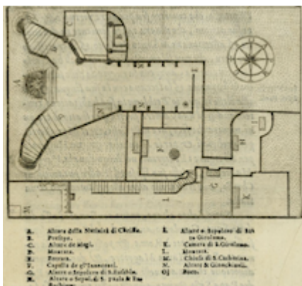
aves beneath the Basilica of the Nativity. Il devotissimo viaggio di Gerusalemme . Jean Zuallart (1587), p. 241