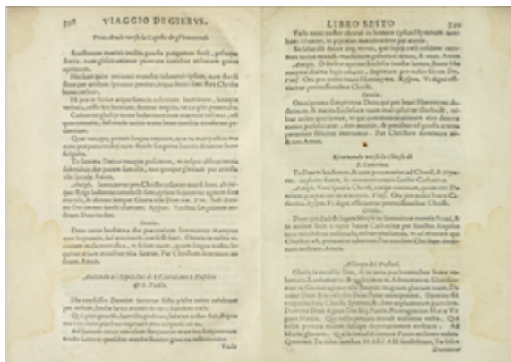
Il devotissimo viaggio di Gerusalemme . Jean Zuallart (1587), pp. 398-399